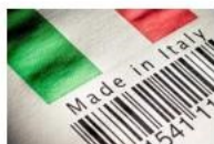
Immagine puramente illustrativa

Norma di riferimento UNI EN 13163:2017 ed UNI EN 13499:2005